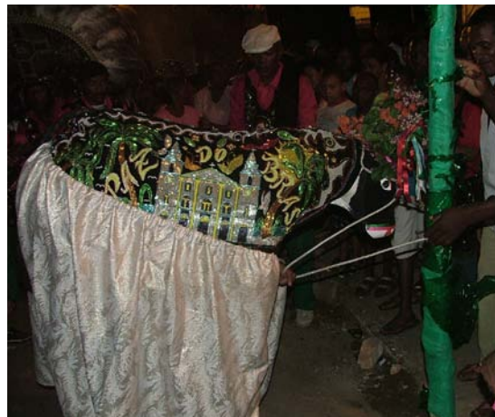
Início da Prostração