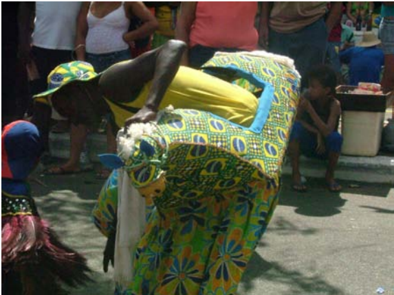
Rolada – Burrinha