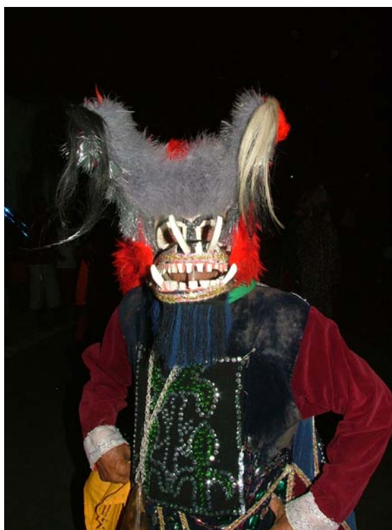
Careta de Cazumba de cabeleira