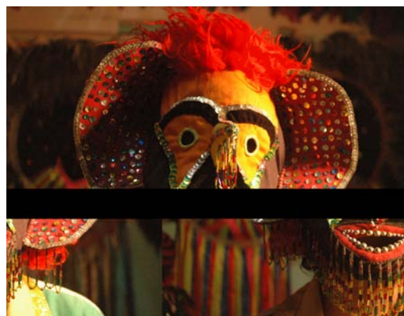
Careta de cazumba de cabeleira