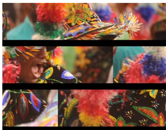
Vaqueiro do Boi de Zabumba