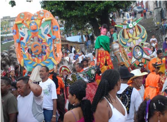
Caipora de Boi da Baixada