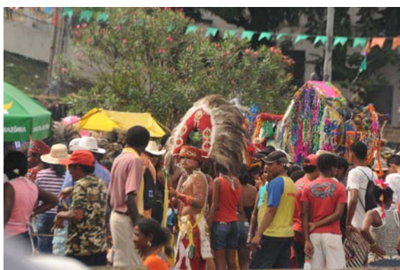
Cacique do Boi da Baixada