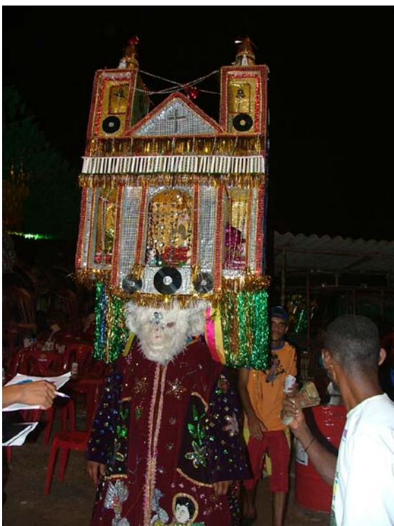
Careta de Cazumba com torre baixa