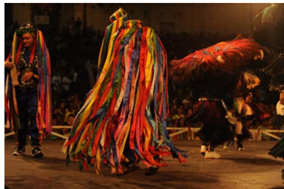
Rajado de Boi de Matraca