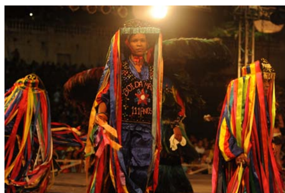
Rajado de Boi de Matraca