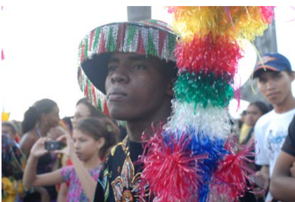
Vaqueiro do Boi de Zabumba