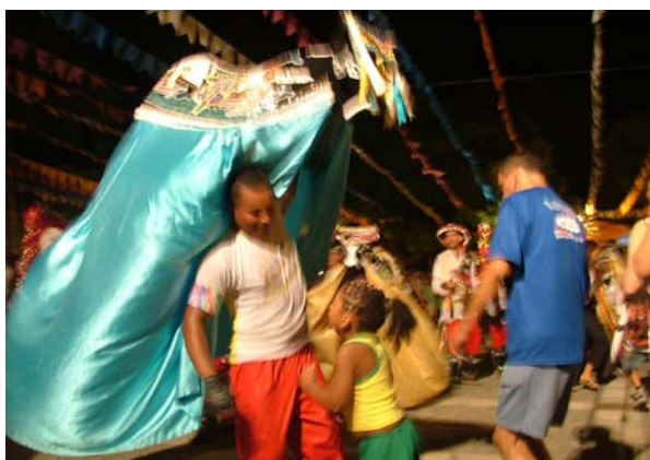
Miolo descobrindo-se para dialogar com plateia