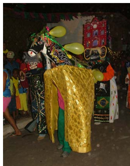
Postura do Boi