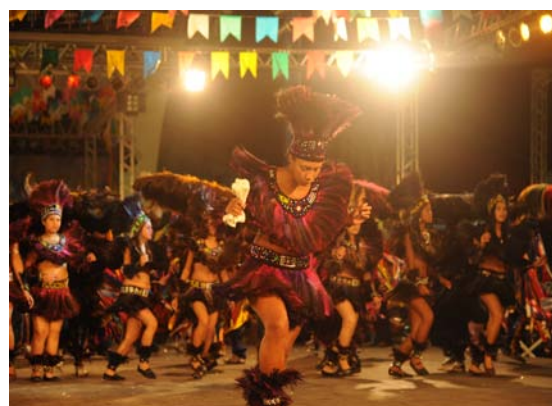
Índias do Boi de Matraca