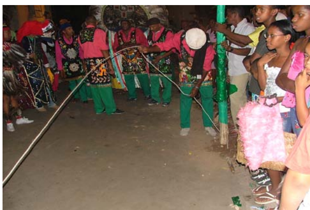
Início da amarração do Boi