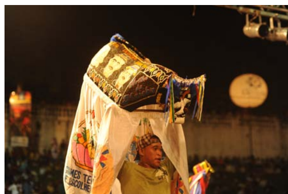
Miolo de Boi de Matraca