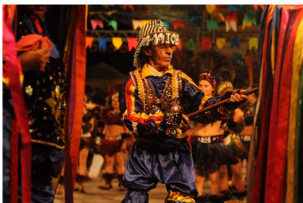
Vaqueiro do Boi de Matraca