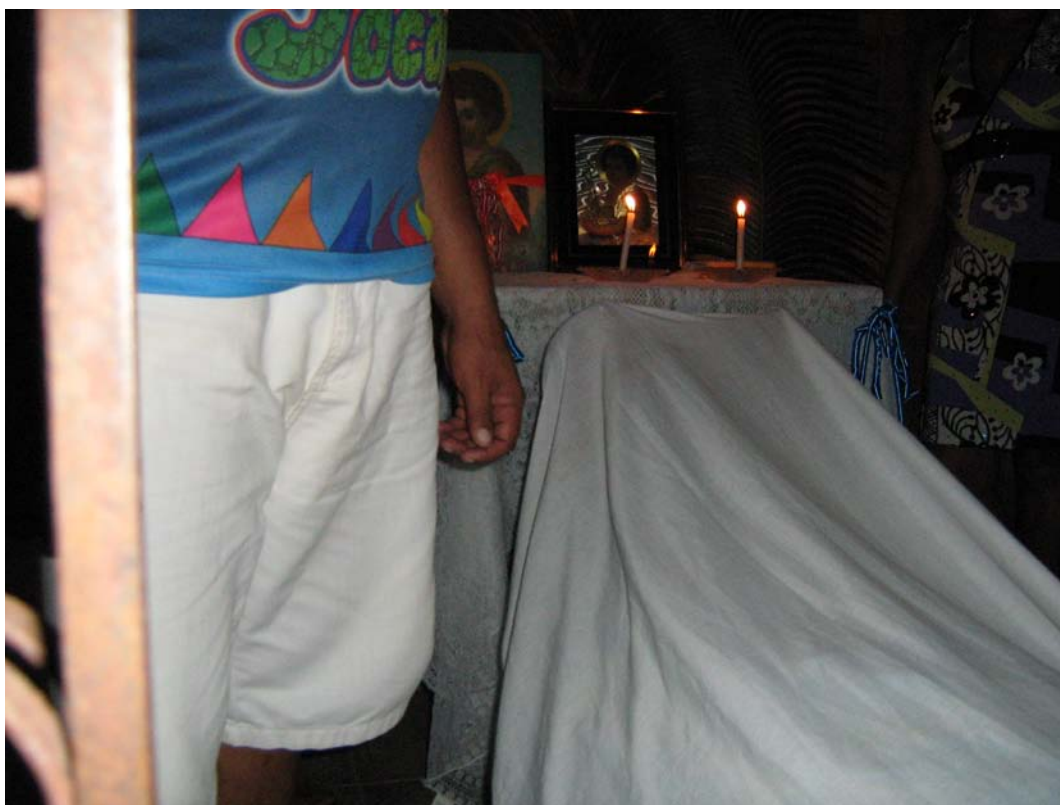
Pagamento de promessa com o boi coberto