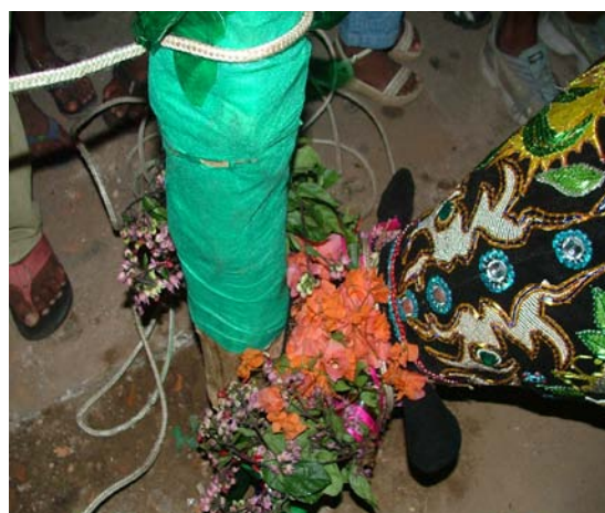
Morte do Boi