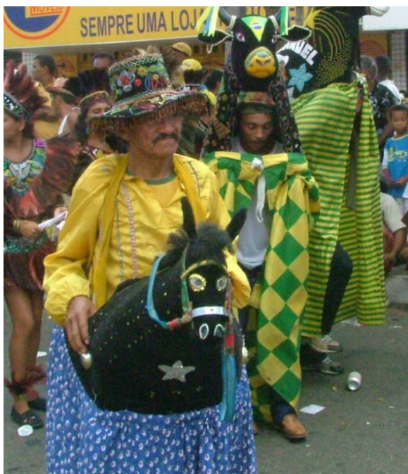
Burrinha no desfile de São Marçal