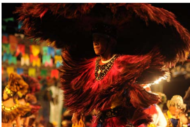
Caboclo de pena do Boi de Matraca