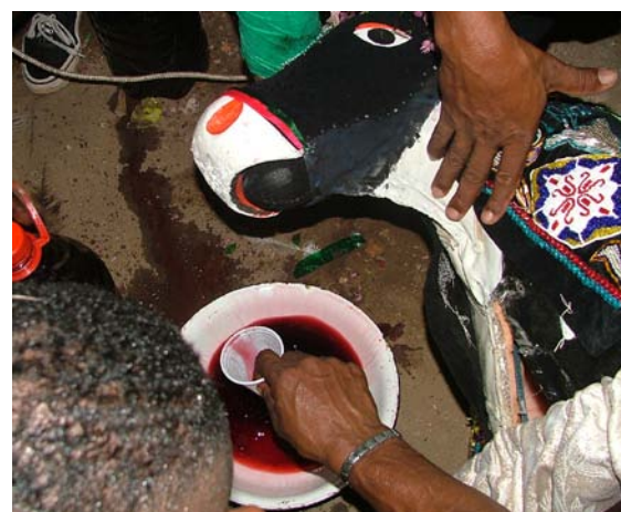
Comunhão do sangue