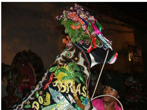
Sujeição do Boi