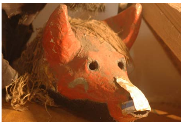
Bicho – Morcego