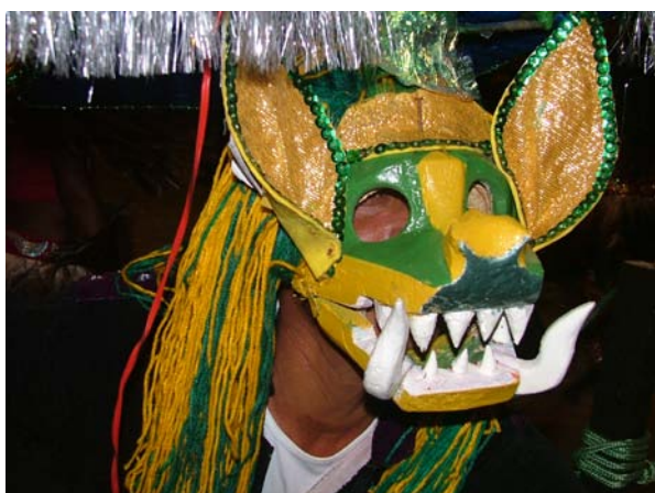
Careta de cazumba