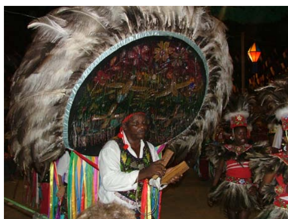
Rajado com capacete do Boi da Baixada