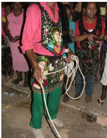
Lançamento do Boi