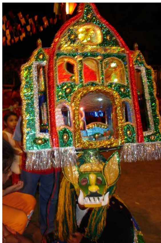
Careta de Cazumba com torre baixa