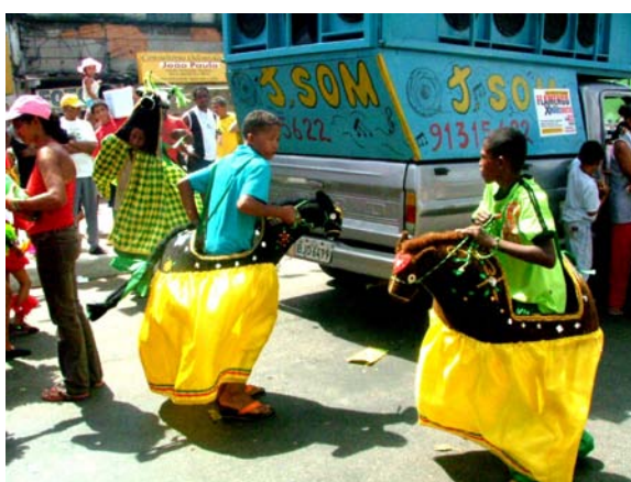
Burrinha no desfile de São Marçal