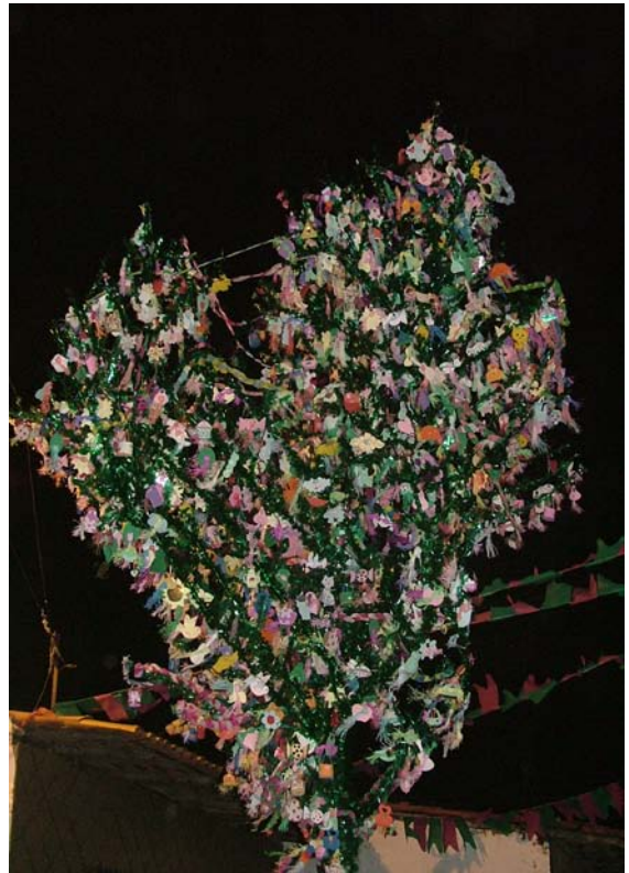
Copa do Mourão