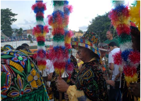
Vaqueiro do Boi de Zabumba