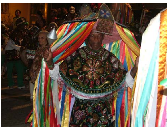
Rajado de Grinalda do Boi de Zabumba