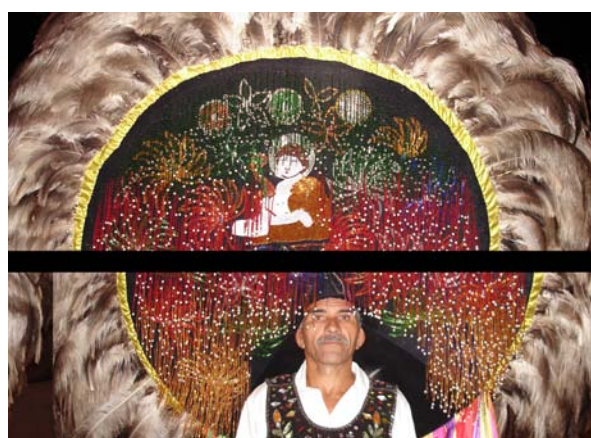
Capacete – Chapéu de Penacho do Boi da Baixada