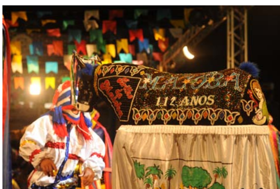
Pai Francisco e Boi de Matraca