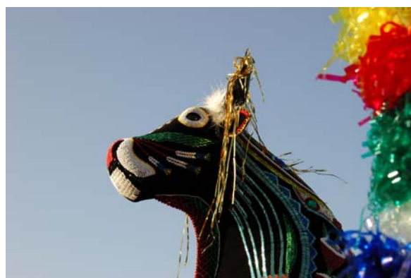
Boi em passo de visgada