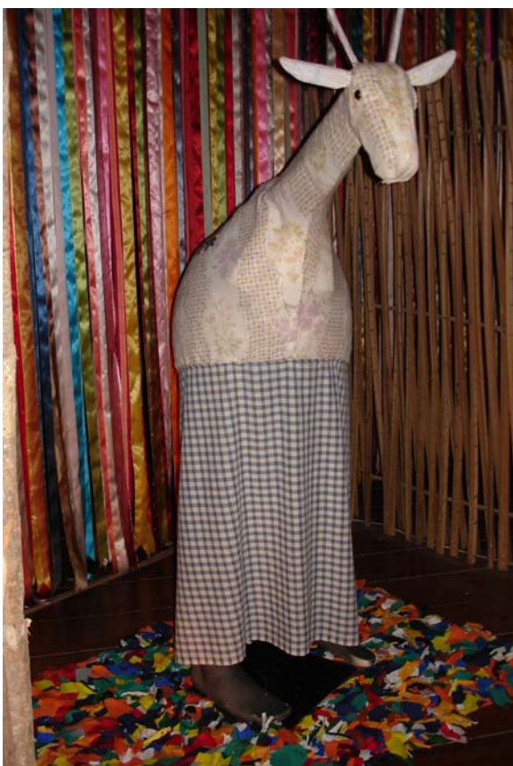
Boi – Girafa