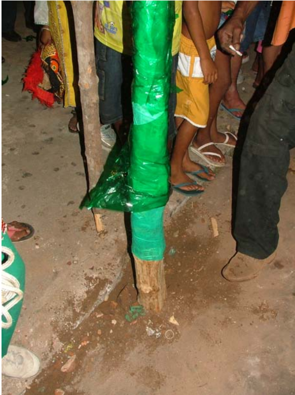
Fincando o Mourão