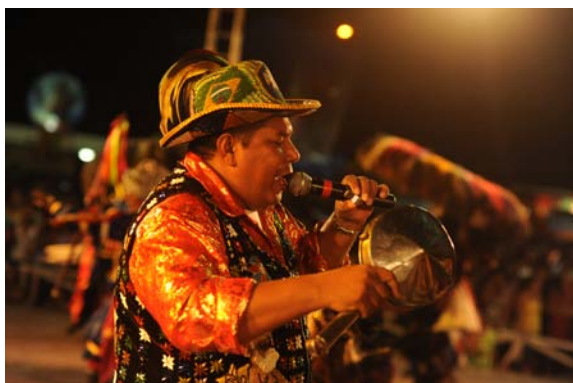
Amo do Boi de Matraca