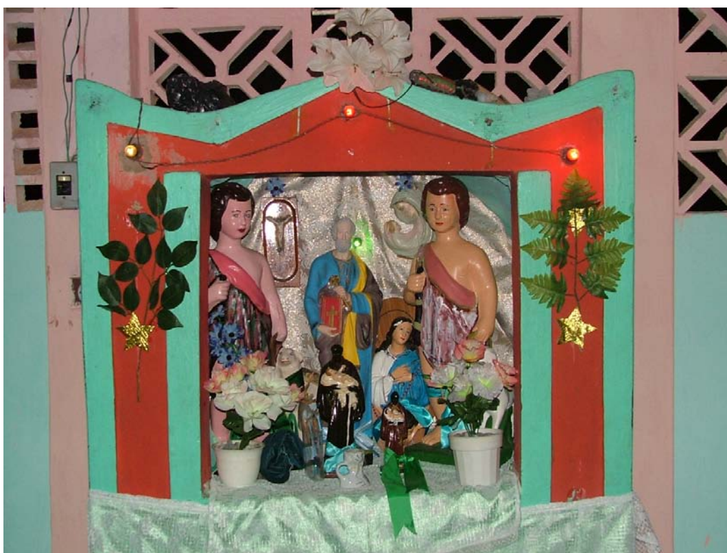
Altar para as ladainhas de São João