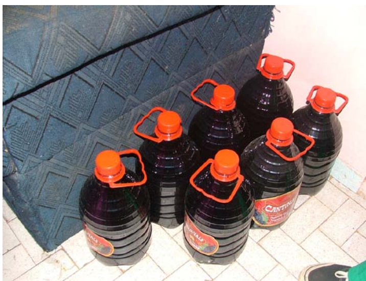
O vinho que se tornará sangue no pé do mourão